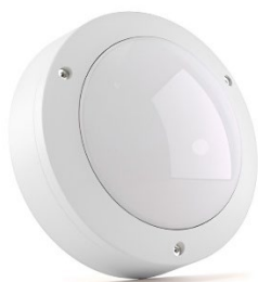
Рис.2. Габаритные размеры светильников