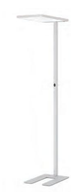
Рис.1. Внешний вид светильника